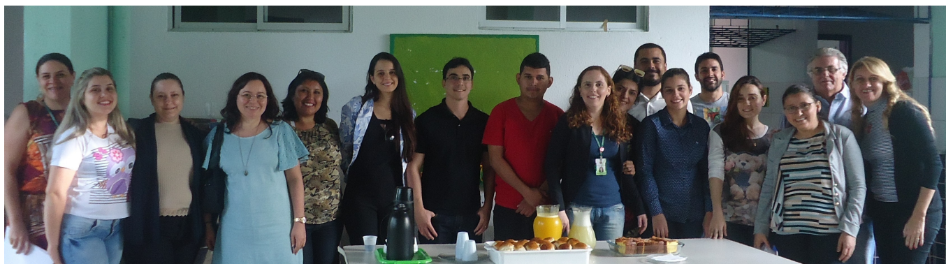
Recepção aos novos docentes do campus de Ubajara