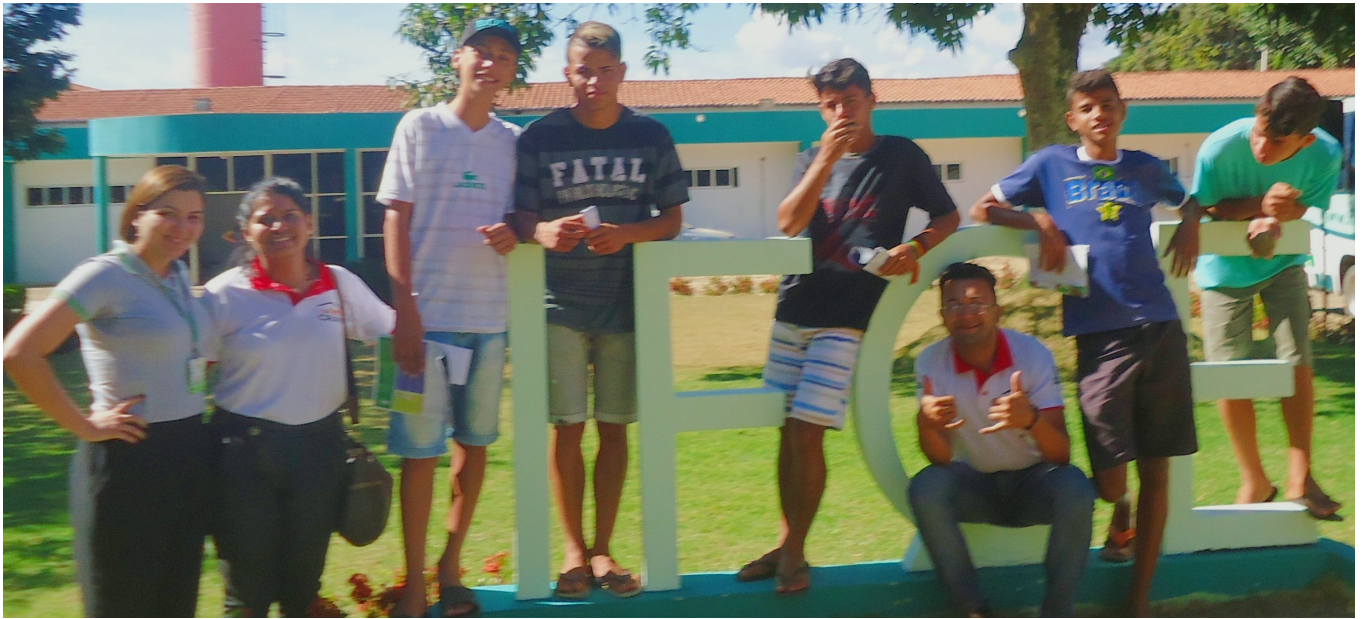
Jovens do CRAS I de Ubajara durante visita ao campus