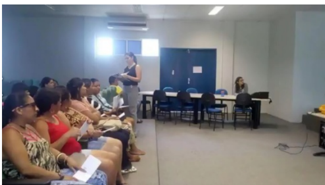
Visita do grupo de mulheres do CRAS I

Também houve a visita de cerca de 50 alunos da escola Rosa Martins – Anexo do Alto Lindo.