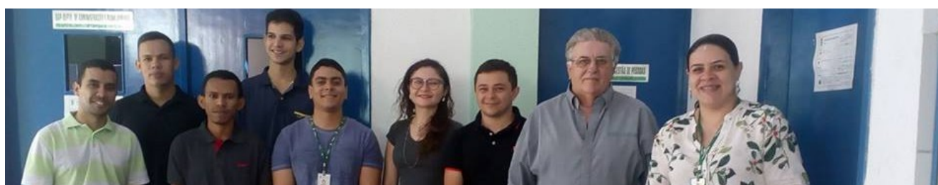
Recepção aos novos técnicos administrativos do campus de Ubajara

O campus de Ubajara recebeu 18 novos servidores entre os meses de julho e agosto. No dia 17 de julho, doze professores entraram em efetivo exercício no IFCE Ubajara. E, no dia 31 de agosto foi a vez de 06 técnicos administrativos. Para recebê-los, a direção geral e a coordenação de Gestão de Pessoas, juntamente com a direção de ensino organizaram uma programação de recepção.