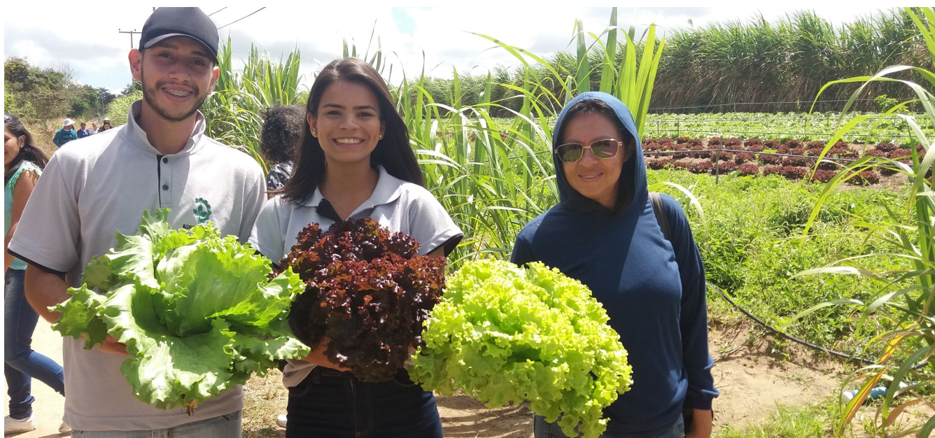
Alunos ficaram animados com a qualidade da produção orgânica da serra