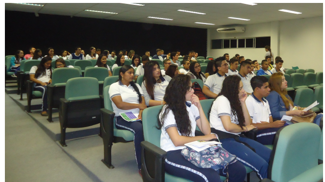
Alunos do anexo do Alto Lindo