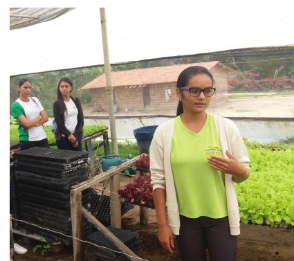
A técnica da fazenda explicando a metodologia do plantio orgânico aos alunos

Segundo o docente, momentos assim são de extrema importância na formação técnica dos alunos dos Cursos de Alimentos e Agroindústria