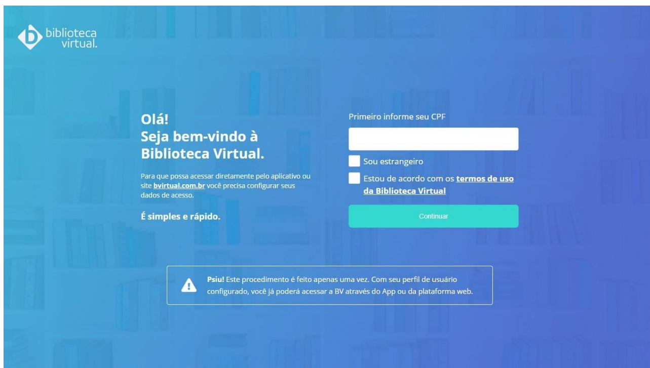
Figura 4. Tela inicial da Biblioteca Virtual via plataforma PEARSON.

Depois de inserir as primeiras informações solicitadas na tela anterior, o aluno deverá preencher a tela exposta na Figura 5, que solicita as seguintes informações: