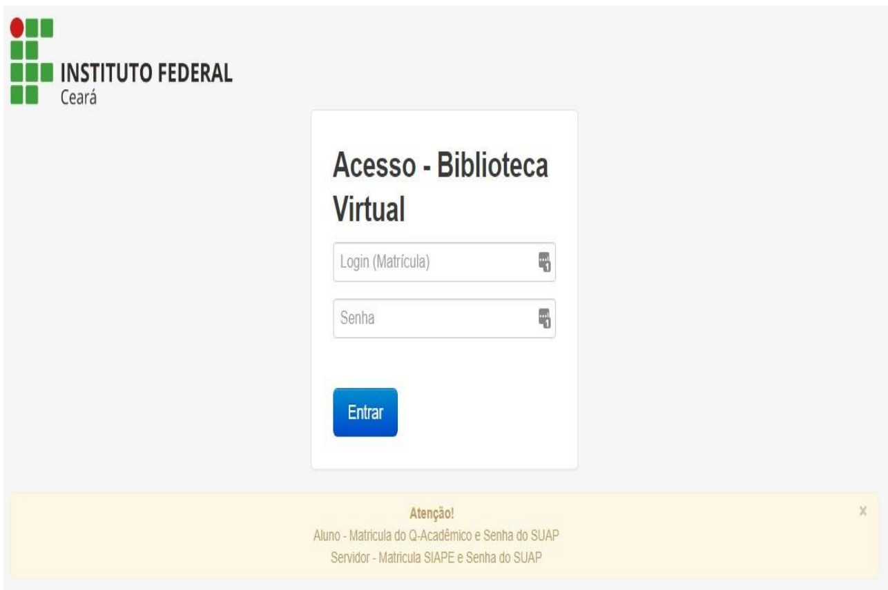
Figura 3. Tela inicial da BV.

Acesse http://bv.ifce.edu.br , conforme Figura 3, informe sua matrícula acadêmica e sua senha cadastrada no SUAP nos respectivos campos.