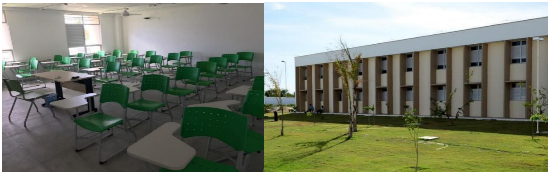
Figura 2: Sala de aula & Bloco de Ensino do Curso Tecnologia em Gestão Ambiental no IFCE Campus Paracuru.

As salas de aula ficam nos blocos de ensino e são bem iluminadas, arejadas e com carteiras ergonômicas modelo padrão do IFCE. As salas possuem ventilação natural e quadros de vidro também no modelo padrão do IFCE.