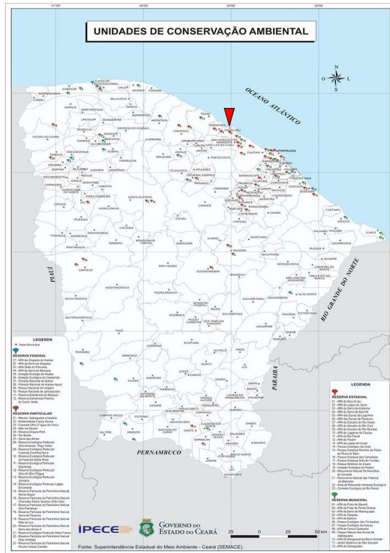
Figura 1: Mapa do Estado do Ceará (Paracuru: 80Km de Fortaleza – Litoral Oeste).

Portanto, a formação em Gestão Ambiental é crucial para promover a sustentabilidade e a inovação dentro dos setores produtivos locais, oferecendo soluções para a gestão eficiente dos impactos ambientais, o cumprimento de legislações vigentes, e a implementação de sistemas de gestão ambiental que assegurem a viabilidade econômica junto à responsabilidade ambiental e social. Profissionais qualificados nesta área são fundamentais para mediar o equilíbrio entre o desenvolvimento econômico e a conservação ambiental, garantindo a competitividade das empresas na região diante de um mercado cada vez mais exigente por práticas sustentáveis.