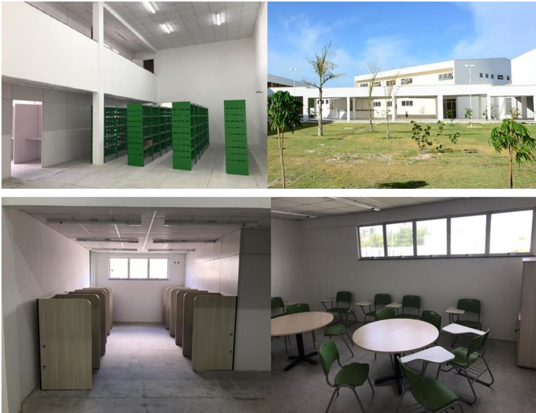
Figura 3: Biblioteca do IFCE Campus Paracuru.

A biblioteca possui um bloco específico com estantes modelo padrão do IFCE e espaços de estudo individual, estudo coletivo e computadores para pesquisa dos alunos. O acervo bibliográfico foi adquirido ano a ano conforme os cursos da área de meio ambiente foram sendo implementados. Atualmente todos os livros do curso já foram comprados. O acervo será complementado para o número de alunos e cursos da área ano a ano, conforme a implantação do curso. Conta ainda com um auxiliar de biblioteca e uma bibliotecária.