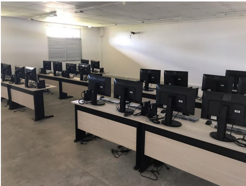
Figura 4: Laboratório de Informática do IFCE Campus Paracuru.

Nos 03 (três) laboratórios de Química e Bioquímica; Microscopia e Microbiologia e Biologia Geral do IFCE Campus Paracuru, também são executadas práticas de disciplinas tanto do eixo “interdisciplinar” quanto do eixo “diagnóstico ambiental” que apresenta relevante importância na formação dos dos alunos do curso de Tecnologia em Gestão Ambiental do Campus Paracuru.