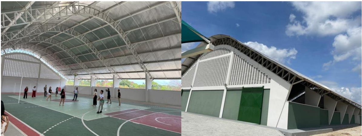
Figura 7: Quadra poliesportiva do IFCE Campus Paracuru

A quadra serve como um espaço para a promoção do ensino, desenvolvimento social e saúde, além de servir para a realização de eventos e formação interdisciplinar dos alunos.