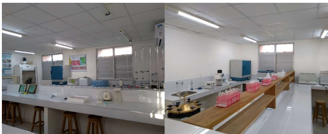
Fotos: Laboratórios de “Análises Ambientais I e II” do IFCE Campus Paracuru.

Nesses 02 (dois) laboratórios são executadas práticas de disciplinas do eixo “diagnóstico ambiental” que apresentam relevante importância na formação dos alunos do curso de Tecnologia em Gestão Ambiental do Campus Paracuru.