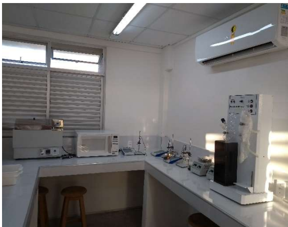
Fotos: Laboratórios de “Química e Bioquímica”; “Microscopia e Microbiologia” e “Biologia Geral” do IFCE Campus Paracuru.