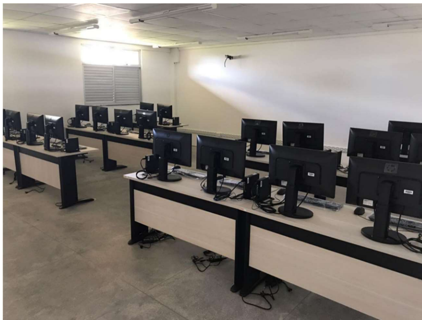
Foto: Laboratório de Informática do IFCE Campus Paracuru.

disciplinas obrigatórias como: “Estatística Aplicada”, “Topografia e Sensoriamento Remoto”, “Estudos Ambientais”, etc. O laboratório conta com 30 (trinta) computadores com internet a cabo que possibilitam a utilização de software livres e de grande impacto na formação dos alunos do curso de Tecnologia em Gestão Ambiental do Campus Paracuru.