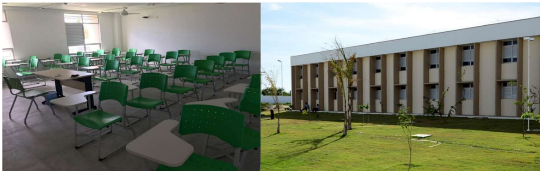
Fotos: Sala de aula & Bloco de Ensino do Curso Tecnologia em Gestão Ambiental no IFCE Campus Paracuru.

As salas de aula ficam nos blocos de ensino e são bem iluminadas, arejadas e com carteiras ergonômicas modelo padrão do IFCE. As salas possuem ventilação natural e quadros de vidro também no modelo padrão do IFCE.