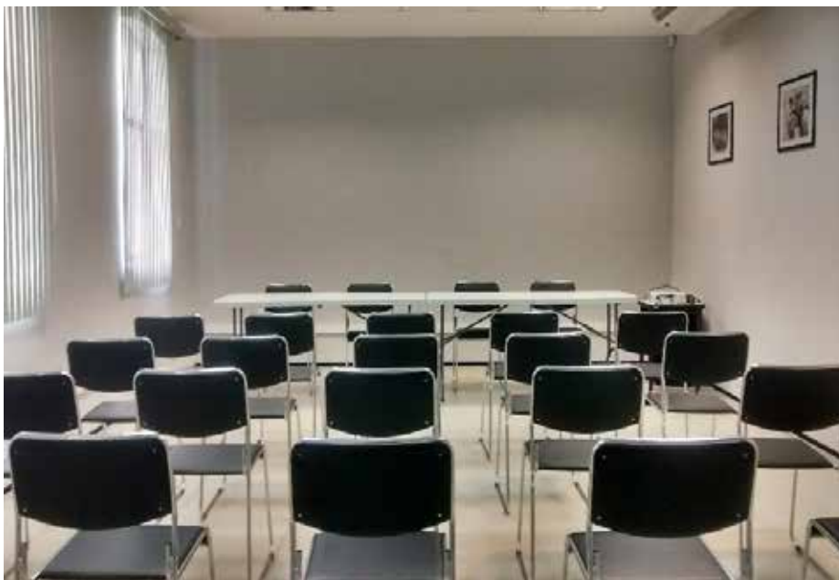
OPÇÃO 05 (45 PESSOAS)