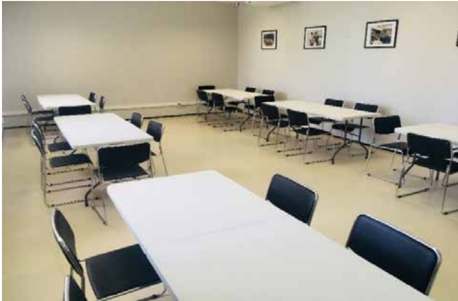
OPÇÃO 03 (30 PESSOAS)