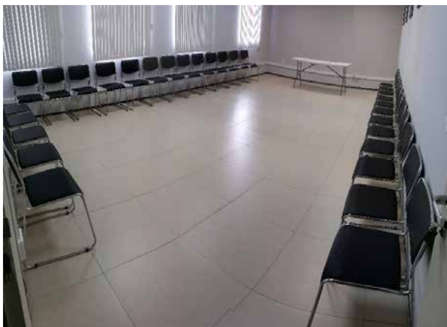
OPÇÃO 01 (30 PESSOAS)

Dispomos de uma sala de recepção, sala de audiovisual em instalação, sala de reuniões e oficinas. A sala de reuniões/oficinas pode ser utilizada em cinco layouts diferentes que se apresentam abaixo. É conveniente observar que os layouts foram desenhados considerando-se a capacidade de carga do espaço, não sendo possível alterar o número de cadeiras em nenhum deles.