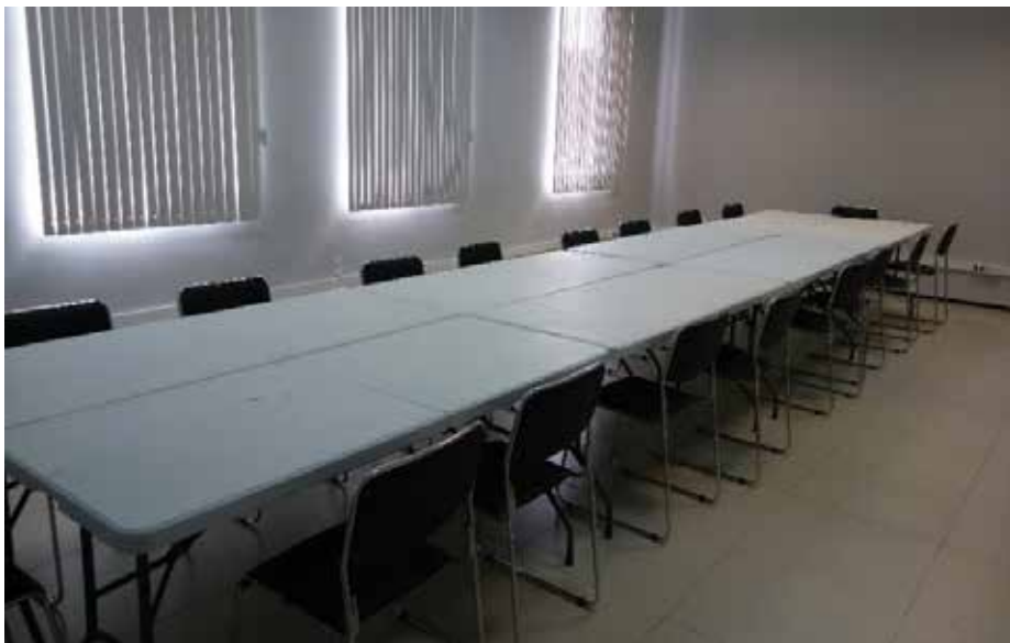
OPÇÃO 04 (20 PESSOAS)