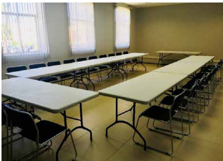
OPÇÃO 02 (25 PESSOAS)