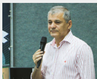
Firmo Camurça (prefeito de Maracanaú)