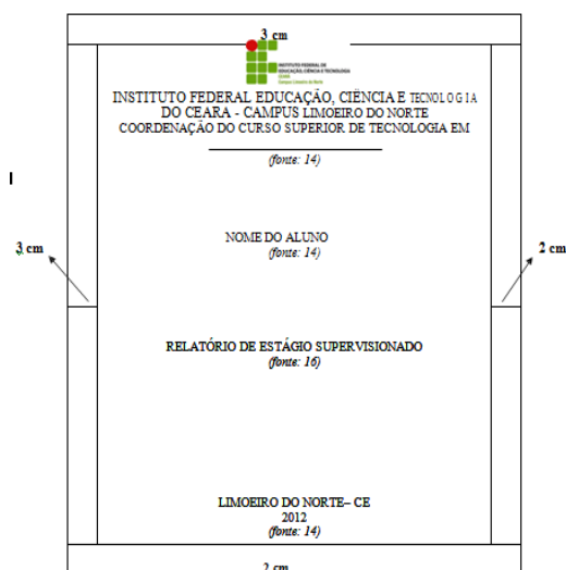
Figura 1 – Modelo da Capa

Parte externa do volume contendo a identificação do trabalho: a logomarca e o nome do IFCE e da coordenação responsável, tipo de trabalho e título, o nome do estagiário, local e ano de depósito.