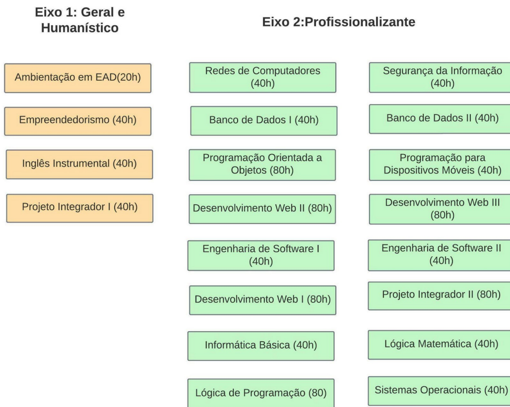
Figura 01 - Eixos de competências