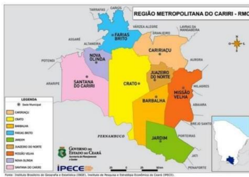
Figura 2 - Mapa da Região Metropolitana do Cariri, em relação geográfica ao Ceará