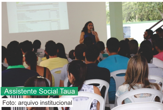
Assistente Social Taua

Para operacionalizar tais ações, tendo por base os princípios supramencionados, serão utilizados os seguintes instrumentos e