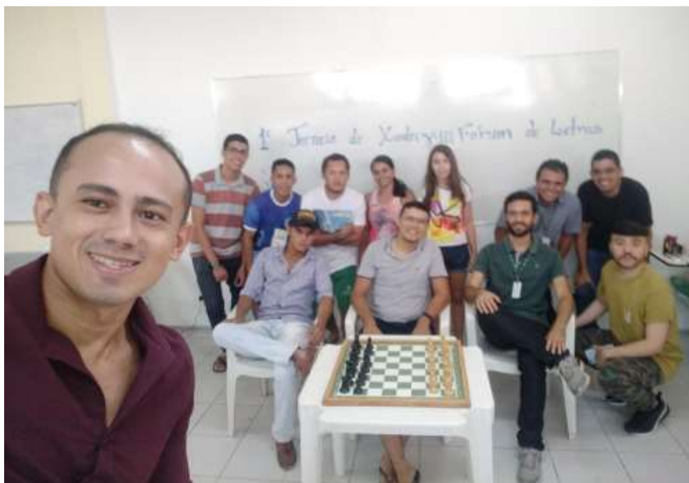
III Fórum de Letras, torneio de xadrez.