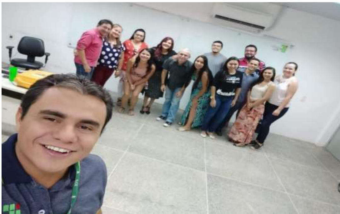
Apresentação de TCC (qualificação)