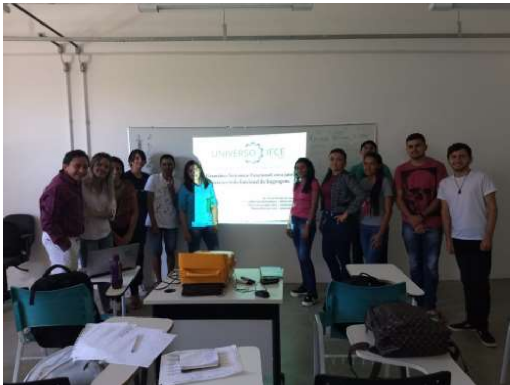
III Fórum de Letras, minicurso sobre a GSF.