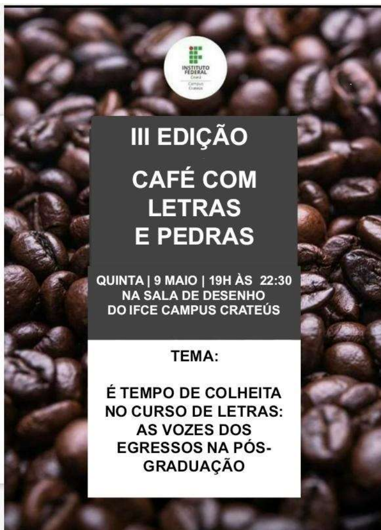
Cartaz do III Café do Letras e Pedras