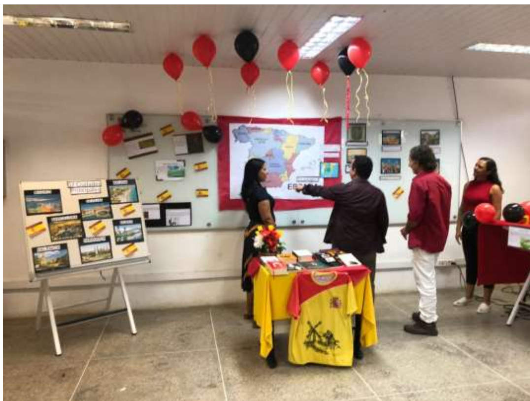
Curso de Extensão de Língua Espanhola.

Quanto à ação relacionada ao Programa de Extensão em Língua Espanhola , tivemos a seleção para uma nova turma iniciante, além da continuação da turma já em andamento. Os alunos também participaram do curso de extensão em Língua Espanhola na organização do evento "¡Viva la Espanidad!", que aconteceu durante o III Fórum de Letras. Neste evento foram apresentadas curiosidades sobre aspectos culturais de países como Espanha, México e Argentina. Foi um momento muito rico de integração e aprendizagem envolvendo alunos de diversos cursos.