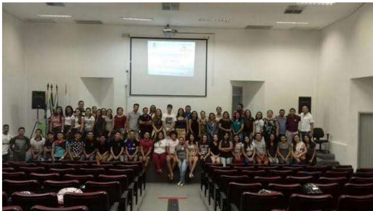
1º Encontro do PRP Letras e Matemática/Física.

No que diz respeito à ação de execução do Programa Residência Pedagógica - PRP , houve uma considerável adesão e empenho dos alunos participantes. Os discentes apresentaram depoimentos retratando a importância da participação no Programa Residência Pedagógica como uma forma de desenvolver suas práticas pedagógicas e conhecer a realidade das escolas contempladas. Aconteceram apresentações dos residentes nas quais foram apresentados as contribuições, as experiências e os desafios do Programa Residência Pedagógica, a exemplo do evento de Canindé, no qual os residentes dos programas daquele campus, bem como os de Crateús e os de Morada Nova apresentaram suas experiências. Além do mais, outros atores que construíam o Programa também apresentaram seus olhares sobre os grandes desafios e conquistas do PRP. O Programa, que está sendo concluído agora em janeiro já possui números positivos para mostrar, a exemplo da ótima performance de duas escolas-campo nas avaliações externas, fato diretamente atribuído à ação dos atores do PRP, de acordo com o grupo gestor das suas instituições, incluindo aí as duas preceptoras.