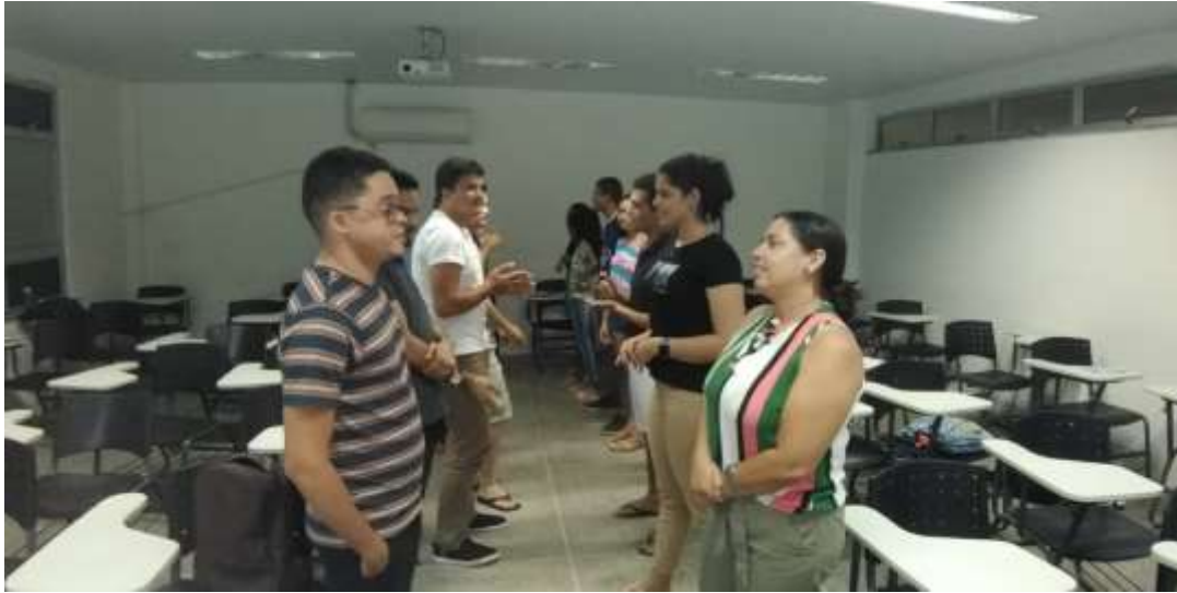
Curso de Extensão de Língua Inglesa.

Em relação às apresentações de TCC, foi grande a participação dos discentes que descreveram para uma banca de avaliadores suas pesquisas em andamento. Foram feitas contribuições por parte dos avaliadores para que os TCCs pudessem ser desenvolvidos de forma satisfatória. As apresentações ocorreram em dois dias, onde os alunos apresentaram seus trabalhos em andamento também para outros discentes, possibilitando um importante momento de troca de experiências.