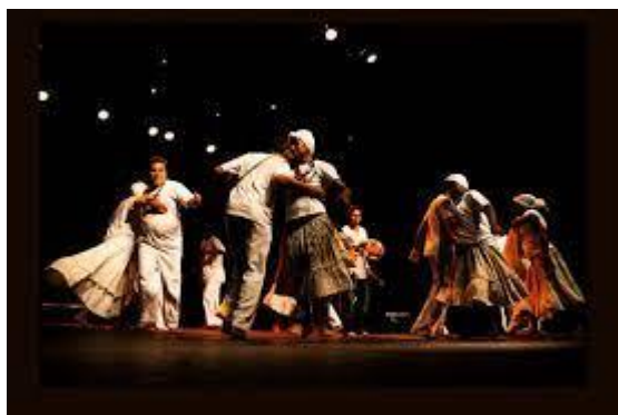
d) O lundu marajoara