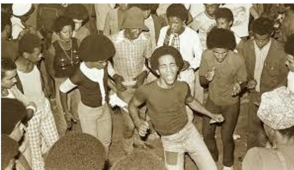
c) O funk e o soul nos bailes black