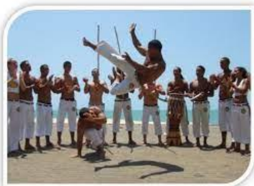
b) A capoeira