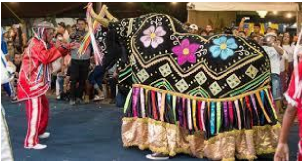
a) O bumba-meu-boi

10 - Quando o hip hop chegou ao Brasil, não se tinha tantas informações sobre o movimento hip hop norte-americano. A música e a dança eram a principal referência sobre o movimento. Quando se falava de hip hop no Brasil, a imagem que se tinha do movimento era o rap e o breaking dance . [...] Na década de 1980, os jovens da periferia já dançavam o break dance e ouviam os raps, estes jovens começaram a fazer seus primeiros encontros na Rua 24 de Maio, grande parte destes jovens era composta por afro-brasileiros. O que colaborou para que o movimento se instalasse de vez no Brasil foi? Observe as imagens e marque a alternativa verdadeira: